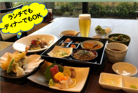
料理イメージ (仕入れ状況により変更になる場合がございます)

小鉢、お造り(生まぐろ)、あつあつ天ぷら、恋する豚のやわらか低温ロースト、ほたるいか沖付け、手作り豆腐、お魚の煮付け、お蕎麦、ご飯デザートなど全10品 ※ドリンク1杯付 (ビール小など)