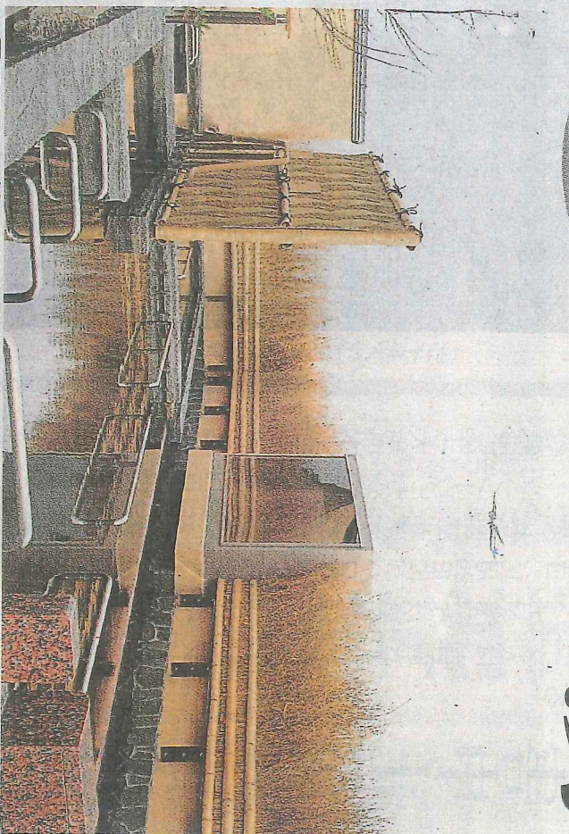
成田空港から眺められる。大画面＝11日、成田空港温泉水の湯

本県が4競技の舞台となる来年夏の東京・リニアで、県は19日から、県内聖火リニアの「リニア」29人を公募する。応募資格は千葉にゆかりがあり、来年4月1日時点で12歳以上の人。障害の有無、国籍を問わない。他薦も可能で、募集期間は来年2月19日まで。来年8月19日に走る。七尾勝元の千葉市内芝