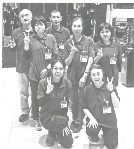
三好店・早朝清掃スタッフの皆さん

そんな仲間の皆に甘え過ぎることなく、温かく細やかな心遣いのできる、しっかりとしたリーダーになれるよう、日々精進したいと思っています。そして、三好店の素晴らしい自慢の仲間たちと、いま以上に最高のチームを作っていこうと思います！