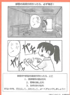
声出し、指指し確認のポスター

け、対外的にも会社の顔として活躍してもらっています。千葉県ビルメンテナンス協会発行の季刊誌『翔』には、SAMが「さんちゃん四コマ漫画」として登場しているんですよ！